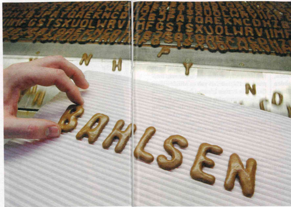
Neben dem Leibniz-Keks wohl das berühmteste Bahlsen-Gebäck: Russisch Brot