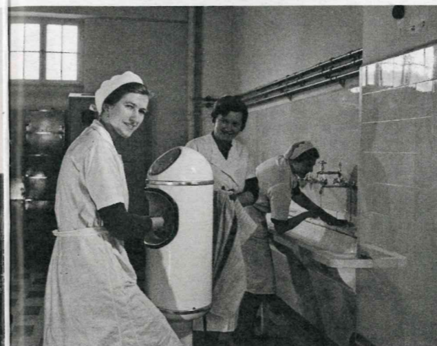
Für alle Arbeiterinnen in der Keksfabrik war Hygiene entscheidend. Dieses Foto entstand Ende der 1930er-Jahre

„ALS HITLER AN DIE MACHT KAM, HAT MAN SICH SCHNELL UMORIENTIERT“