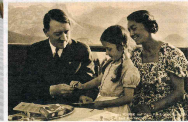
Mit diesem Bild von Hitler mit Bahlsen-Keks wollte das Unternehmen werben, die Naziführung war aber dagegen